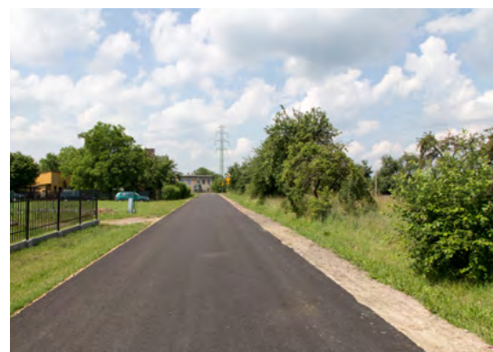
ULICA POLNA W WILCZY