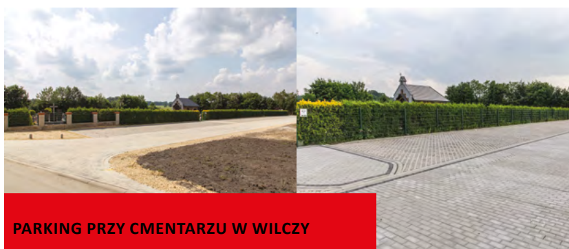
PARKING PRZY CMENTARZU W WILCZY