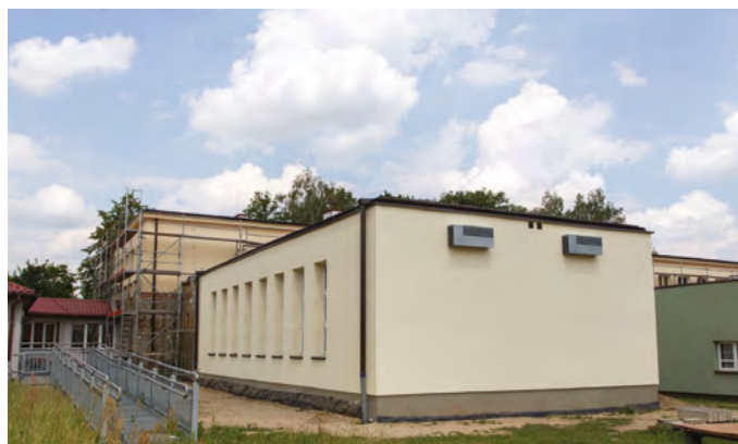
TERMOMODERNIZACJA SZKOŁY W PILCHOWICACH