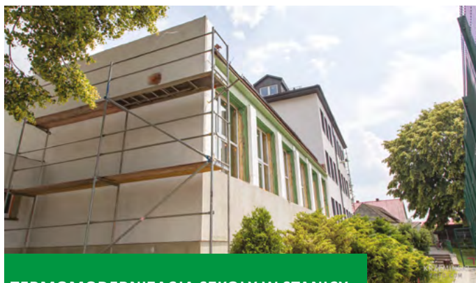
TERMOMODERNIZACJA SZKOŁY W STANICY