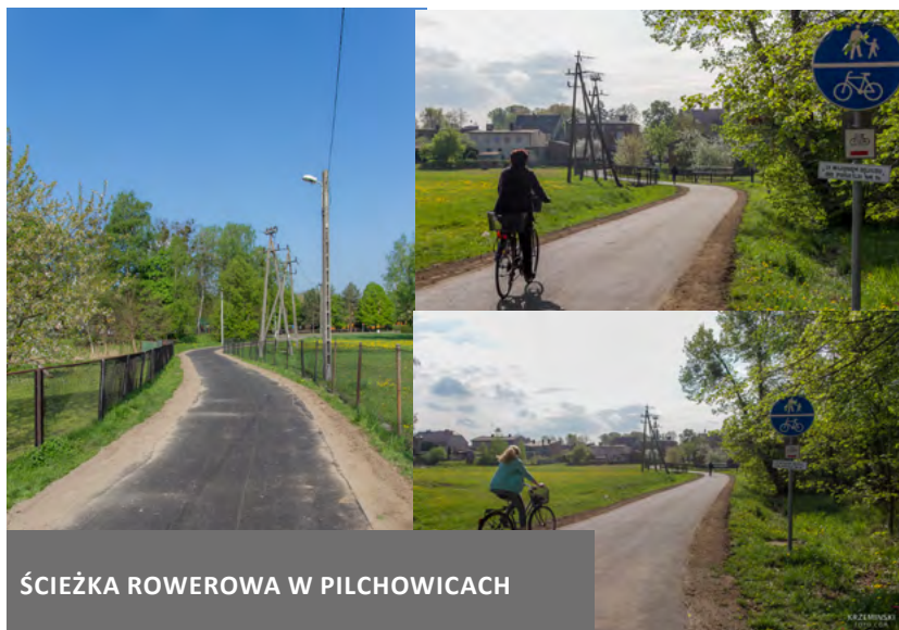
ŚCIEŻKA ROWEROWA W PILCHOWICACH