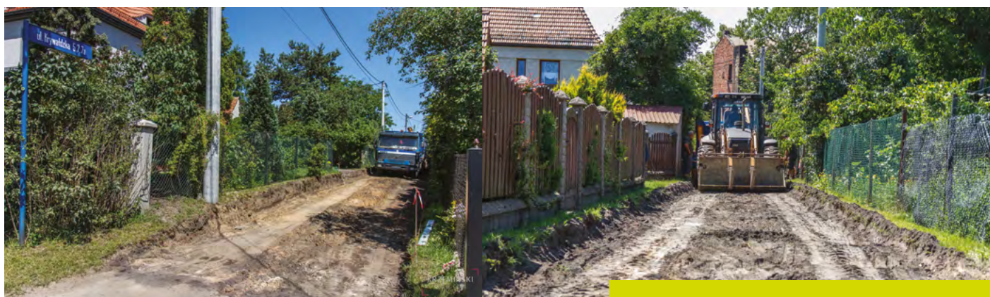
ULICA KRYWAŁDZKA W NIEBOROWICACH