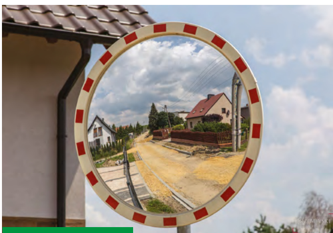
ULICA DWORCOWA W STANICY