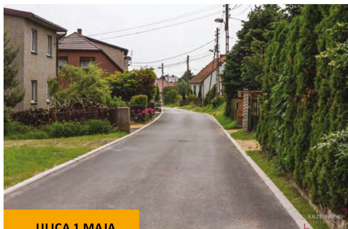
ULICA 1 MAJA W ŻERNICY