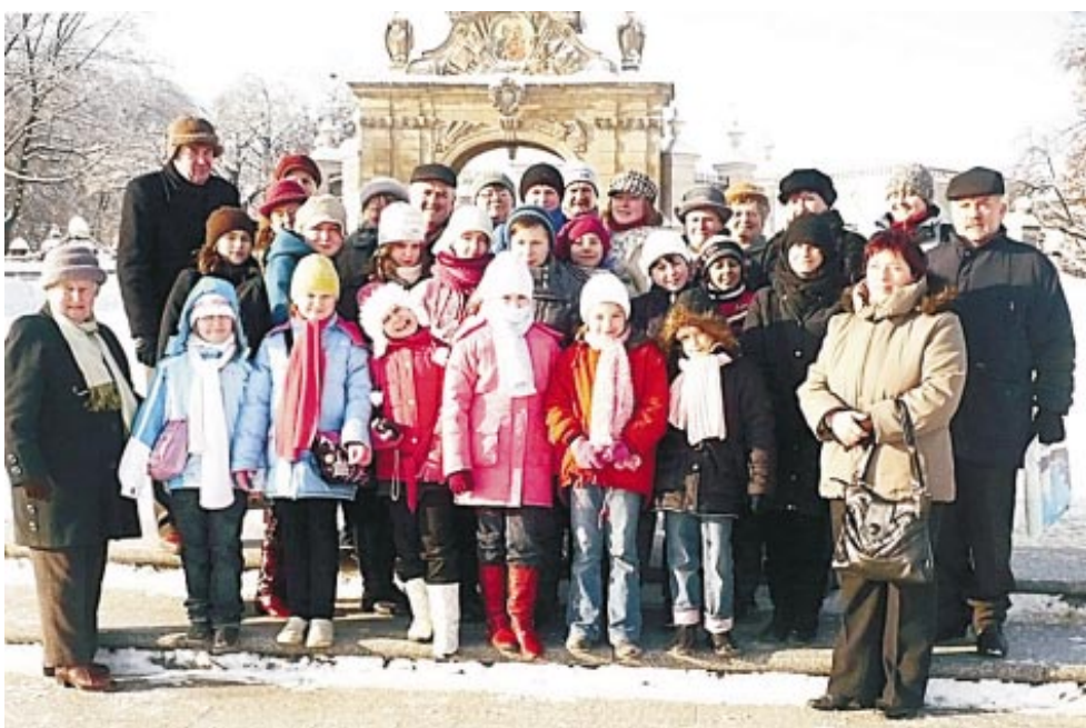
Laureaci konkursów i uczestnicy wycieczki do Częstochowy.

Mimo, że termometry wskazywały niemal minus 20 stopni C, to dobry nastrój i uśmiech nie schodził z twarzy uczestników zimowej wyprawy na Jasną Górę do Częstochowy. Wycieczkę zorganizował Gminny Ośrodek Kultury w Pilchowicach.