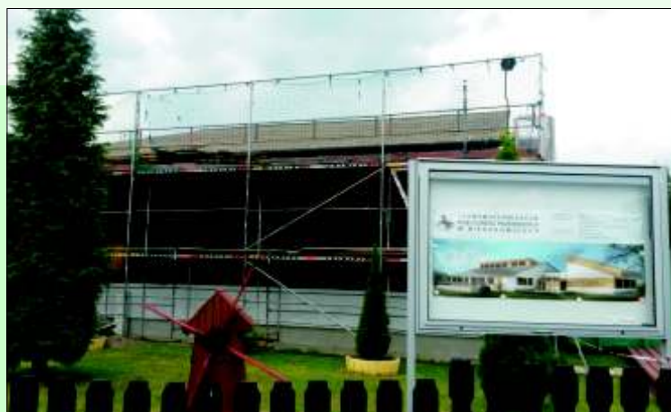
Nieborowickie przedszkole w trakcie termomodernizacji