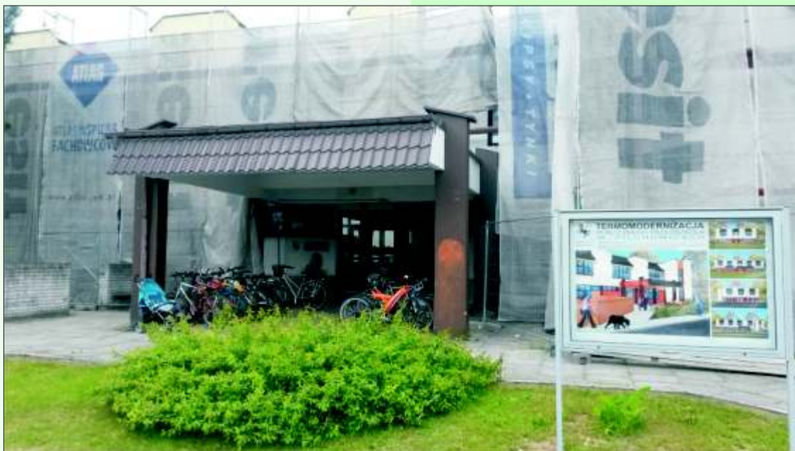
Pilchowickie przedszkole w trakcie termomodernizacji