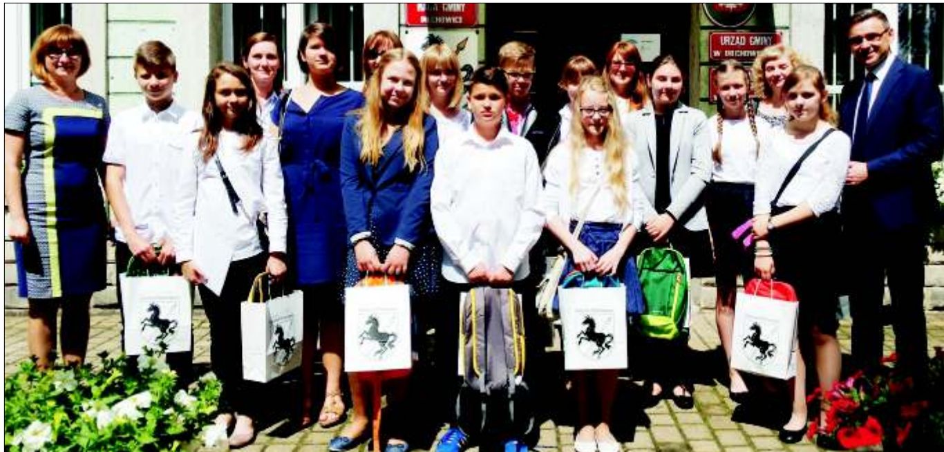
Najlepsi szóstoklasiści Gminy Pilchowice