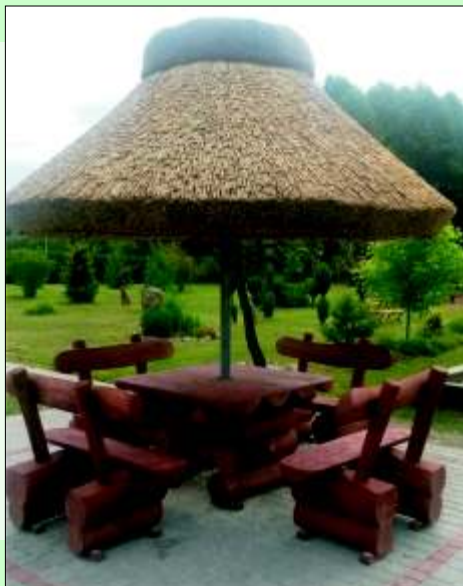
Parasol na "Młynówce"