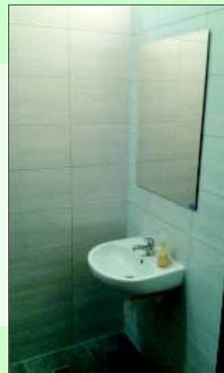
Pomieszczenia OSP Żernica po remoncie