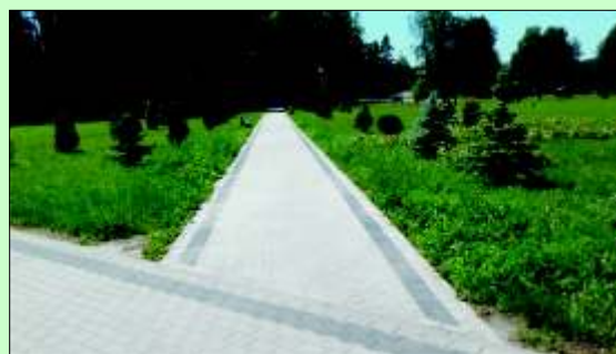
Nowy chodnik w parku Moritza