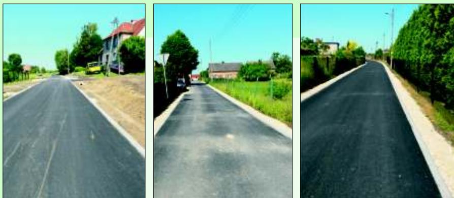
Przebudowane stanickie drogi: ul. Cystersów, ul. Powstańców, ul. Lipowa