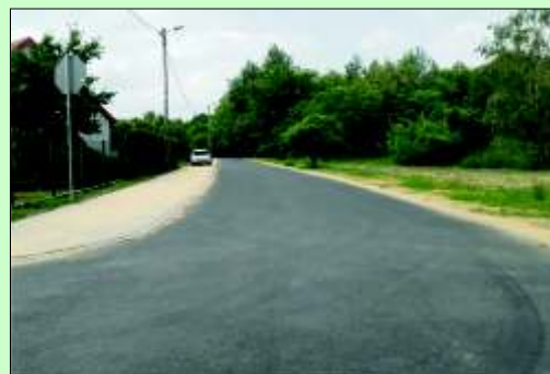
Ul. Cicha po przebudowie