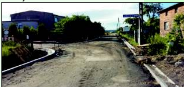
Ul. Krótka w trakcie przebudowy