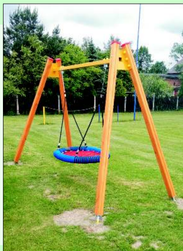
"Bocianie gniazdo" na placu zabaw