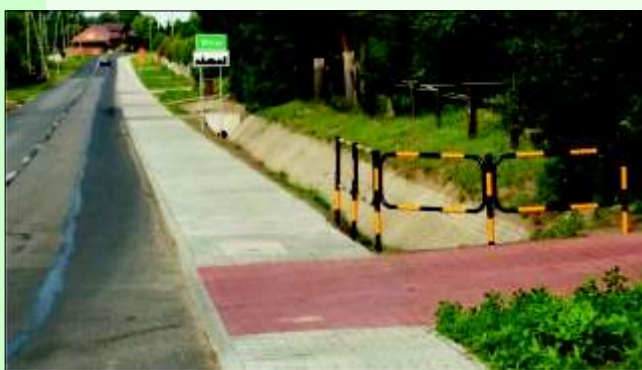
Nowy chodnik w Wilczy