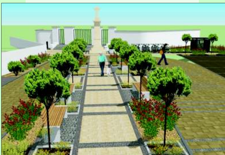
Koncepcja zagospodarowania placu przed kościołem