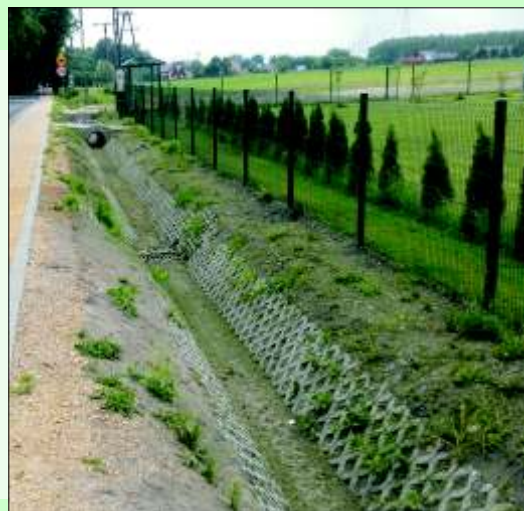
Teren przy boisku na ul. Kasztanowej