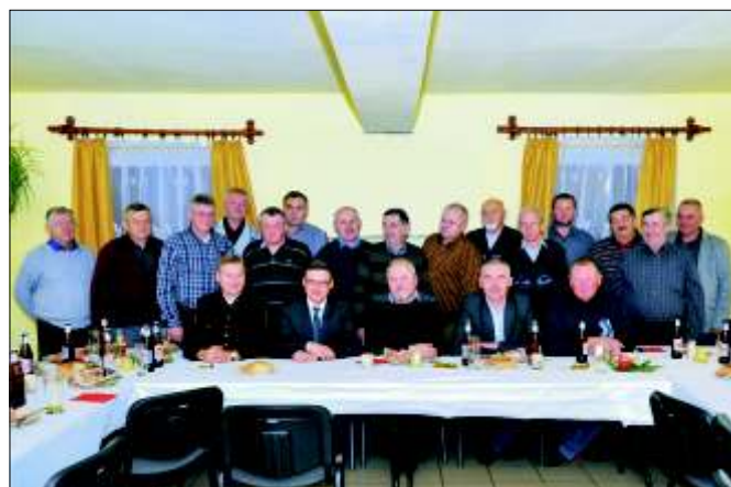
Barbórka zorganizowana przez Koło Chłopa w Stanicy.