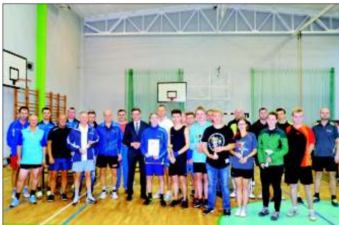
Uczestnicy Mistrzostw Gminy Pilchowice w Tenisie Stołowym.