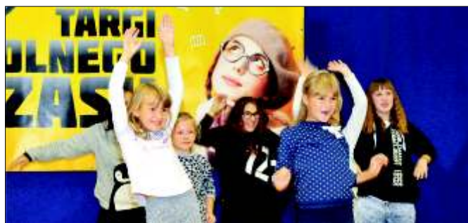
Targi Wolnego Czasu.