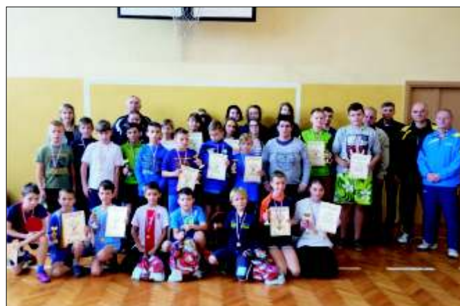
Uczestnicy Gminnego Turnieju Tenisa Stołowego.