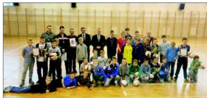
Uczestnicy Gminnych Mistrzostw Szkół Podstawowych w futsalu.