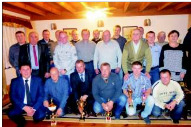
Obchody 55-lecia Sekcji Pilchowice Polskiego Związku Hodowców Gołębi Pocztych.