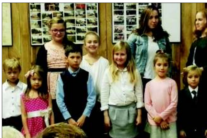
Uczestnicy Koncertu Młodych Talentów organizowanego przez Stowarzyszenie Pilchowiczanie Pilchowiczanom.