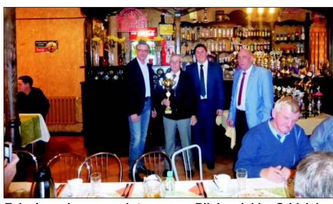
Zakończenie sezonu lotowego w Pilchowickim Oddziale Polskiego Związku Hodowców Gołębi Pocztowych.