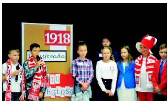
Występ artystyczny młodzieży z wilczańskiej szkoły z okazji Dnia Niepodległości.