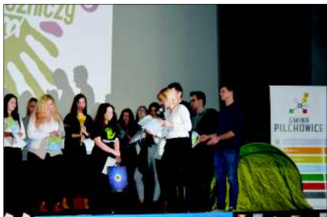
Festiwal podróżniczy Carpe Diem.