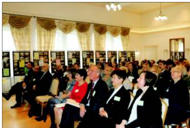
VIII Powiatowa Konferencja Regionalna dla bibliotekarzy, nauczycieli i regionalistów „Kalejdoskop literacki śląskiego humoru i satyry” w Domu Kultury w Żernicy.