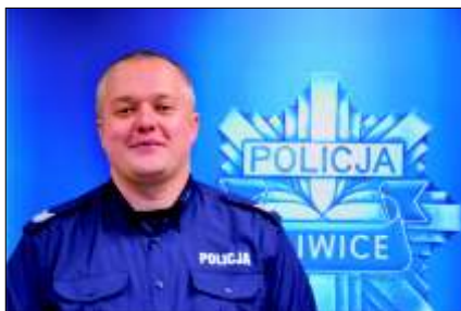
Dzielnicowi w naszej Gminie

adres Komisariatu: ul. Dworcowa 1a 44-190 Knurów fax 32 337-25-14, e-mail: knurow@gliwice.ka.policja.gov.pl