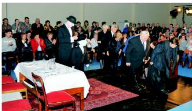
Spektakl Kopidoł w wykonaniu Teatru Naumiony z Ornontowic w Zespole Szkół w Pilchowicach.