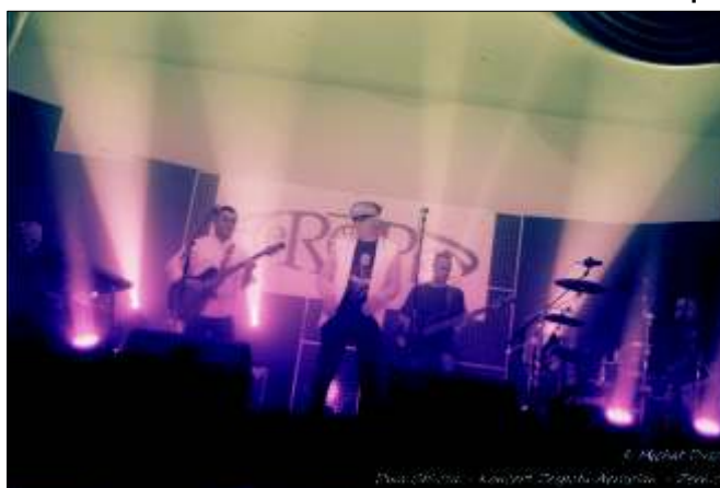
Koncert żernickiego zespołu AEROPLAN.