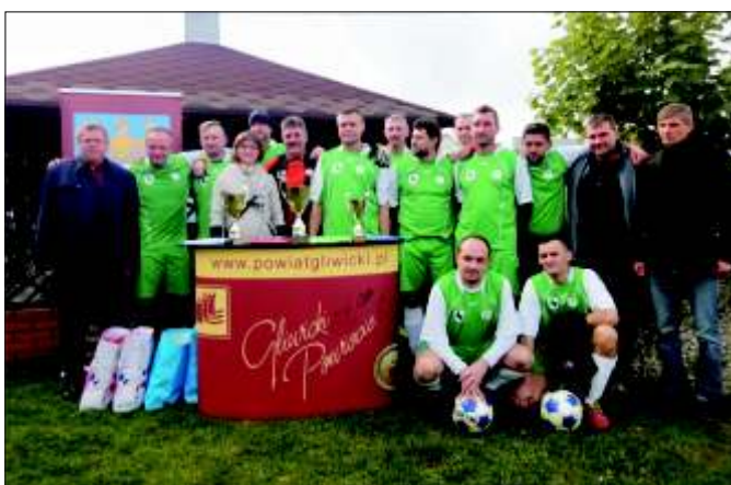
Powiatowi mistrzowie - oldboje z Wilczy.