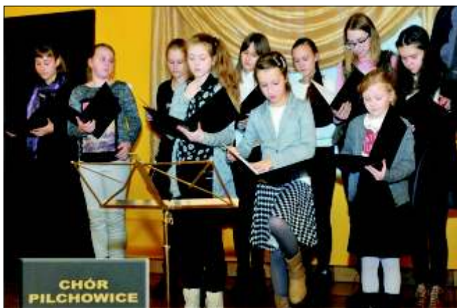
Występ Pilchowickiego Chóru w czasie Dni Seniora.