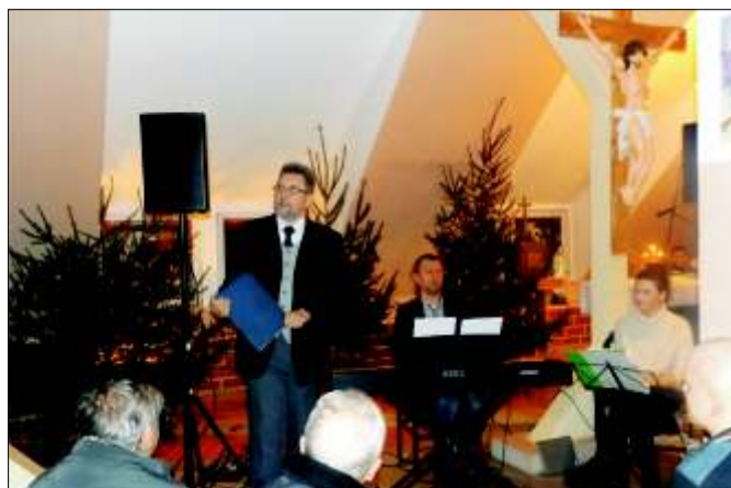
Jazzowe Kolędowanie - koncert z cyklu Magia Muzyki w wykonaniu artystów Filharmonii Śląskiej.