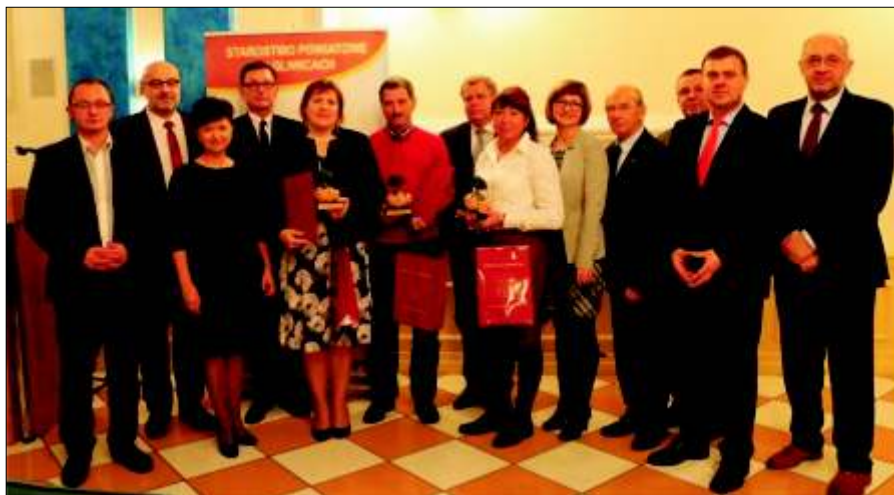
Zwycięzcy konkursu Powiat Przyjazny Środowisku.