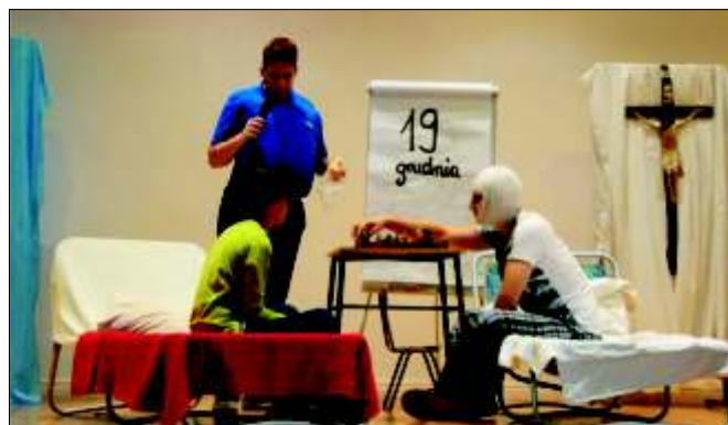
Występ młodzieży ze Szkolnego Koła Caritas z Zespołu Szkolno-Przedszkolnego i Parafii św. Michała Archanioła w Żernicy w charytatywnym spektaklu Oskar i pani Róża.