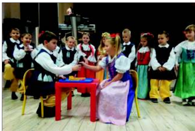
Występ dzieci w czasie obchodów Dnia Górnika w Wilczy.