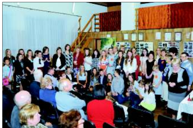
Uczestnicy konkursu poezji im. ks. Damrota.