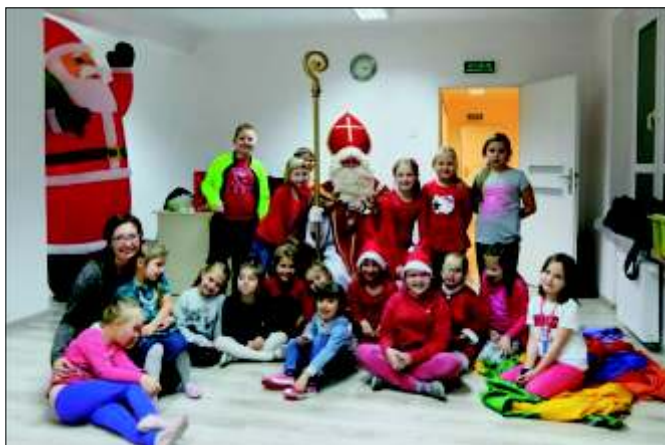
Mikołajki w Pracowni Działań Twórczych.