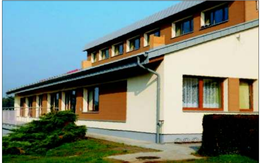
Przedszkole w Nieborowicach po termomodernizacji.

Kolejne dwie duże inwestycje czekają nas w przyszłych latach. W roku 2017