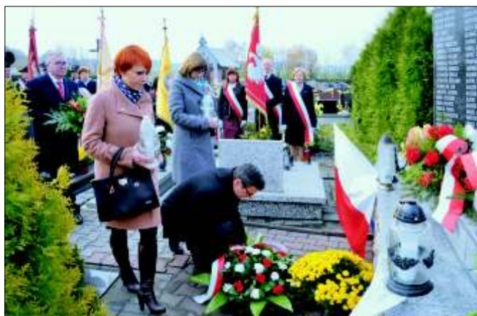
Obchody Święta Niepodległości.