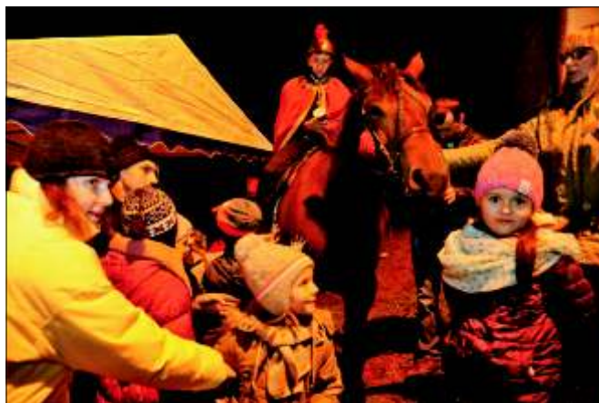
Obchody Święta św. Marcina w Stanicy.