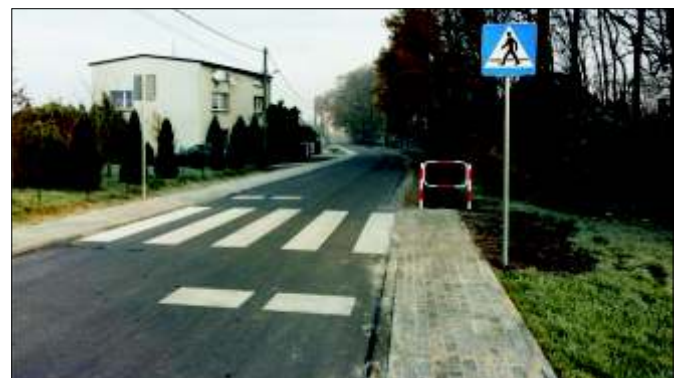
Ulica Trześniówka w Pilchowicach po przebudowie.