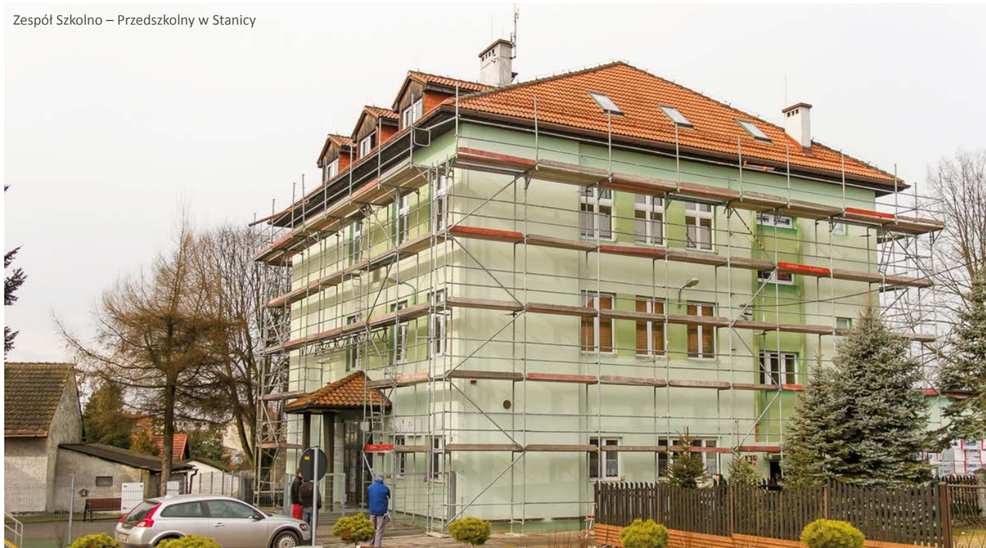
Zespół Szkolno – Przedszkolny w Stancji

Zakres robót jest duży, a czasu na jego wykonanie dość mało. Dlatego wszystkich użytkowników tych budynków, a przede wszystkim uczniów i ich rodziców przepraszamy za utrudnienia. Cierpliwie oczekajmy na efekty. Obie inwestycje mają na celu poprawę efektywności ekologicznej, ale przede wszystkim poprawę warunków nauki naszych uczniów.