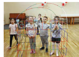
Pracownia Działań Twórczych - zajęcia dla dzieci w wieku 4-7 lat. Rozwijamy nasze talenty i kreatywne myślenie.