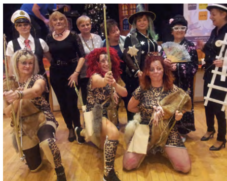
Magiczne ptaszki w zimowym karmniku